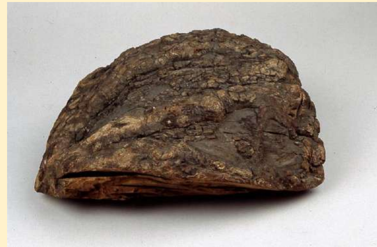
Trozo de árbol en el que se refugió Cortés en la NocheTriste . Según la tradición, Cortés se refugió bajo un gran árbol que crecía cerca de Tacuba y lloró amargamente su derrota. MNM.112

Con escasos medios, sin apenas más apoyo que su inteligencia y su intuición militar y diplomática, logró, en solo dos años, reducir al dominio español el esplendoroso imperio azteca.