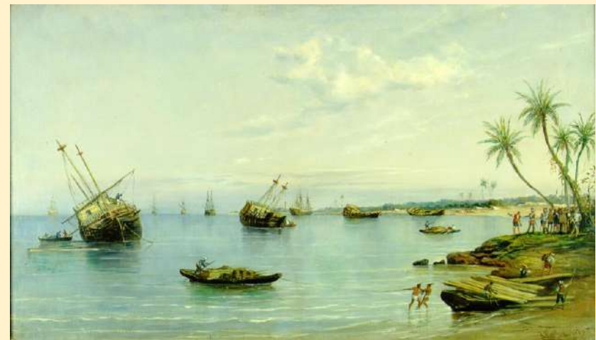
Hernán Cortés ordena dar al través sus navíos. MNM.1231

Para evitar la tentación de regresar que amenazaba a muchos de sus hombres, hundió sus naves en Veracruz.