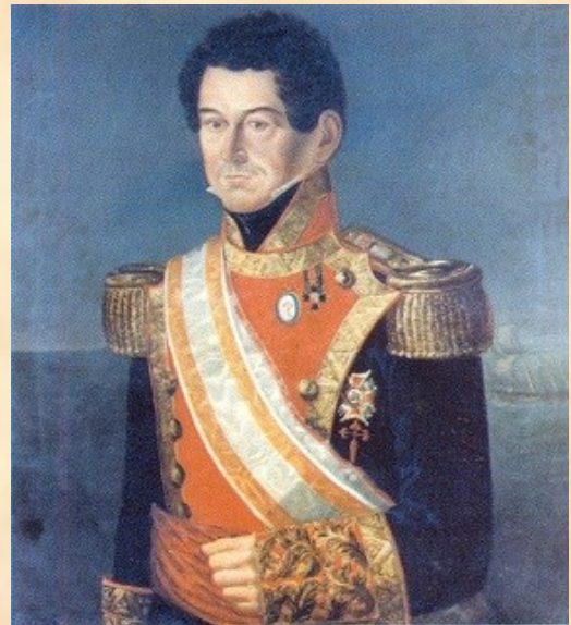
Alejo Gutierrez de Rubalcava y Medina (Museo Naval)

-Tras el combate de Trafalgar fue capaz de llevar a puerto un navío que se encontraba en pésimo estado y cuyos mandos habían fallecido. Al día siguiente salió de nuevo a la mar a prestar auxilio a sus compañeros. Soportó nuevos temporales con el barco seriamente averiado, pero logró salvarlo y entregar su mando.