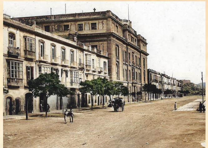
Academia de Guardias Marinas de Cartagena

Los cadetes cursaban materias como aritmética, geometría, trigonometría plana y esférica, navegación e idiomas. También practicaban esgrima y realizaban sus prácticas en un buque de guerra. Para los alumnos más aventajados nació el Curso de Estudios Mayores o de Matemáticas Sublimes, impartido por Gabriel Ciscar, de la que salieron los oficiales más brillantes, algunos de los cuales ocuparon importantes cargos en la Administración del Estado.